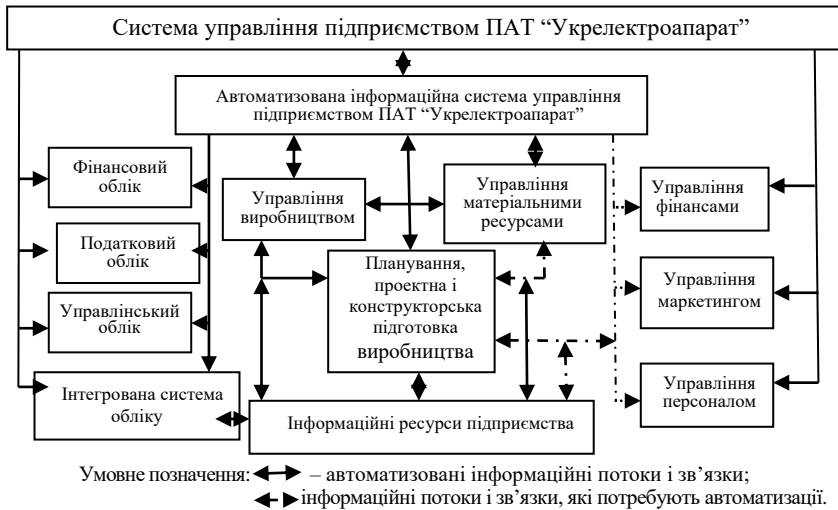
Рис. 2. Схема інформаційної системи управління підприємством ПАТ “Укрелектроапарат”

Більш детально проведено дослідження машинобудівних підприємств Хмельницької області. Виявлено, що особливості побудови їх інформаційних систем пов'язані із специфікою діяльності. До прикладу, в інформаційну систему ТОВ “Завод “Красилівмаш”, на відміну від ДП “Красилівський агрегатний завод”, запроваджено автоматизацію управління виробничою діяльністю. На ПАТ “Укрелектроапарат” – завершуються роботи над створенням електронного документообігу у сфері конструкторських та технологічних операцій. Виявлено інформаційні потоки і зв'язки, які потребують автоматизації, у контексті удосконалення управління інформаційним потенціалом. Основним напрямом, в подальшому розвитку, інформаційної системи машинобудівного підприємства ПАТ “Укрелектроапарат” є розробка програмних модулів створення архіву документів та інформаційних ресурсів управління фінансами, логістикою, маркетингом та персоналом, які дозволять забезпечити повноцінний електронний документообіг на підприємстві (рис. 2).