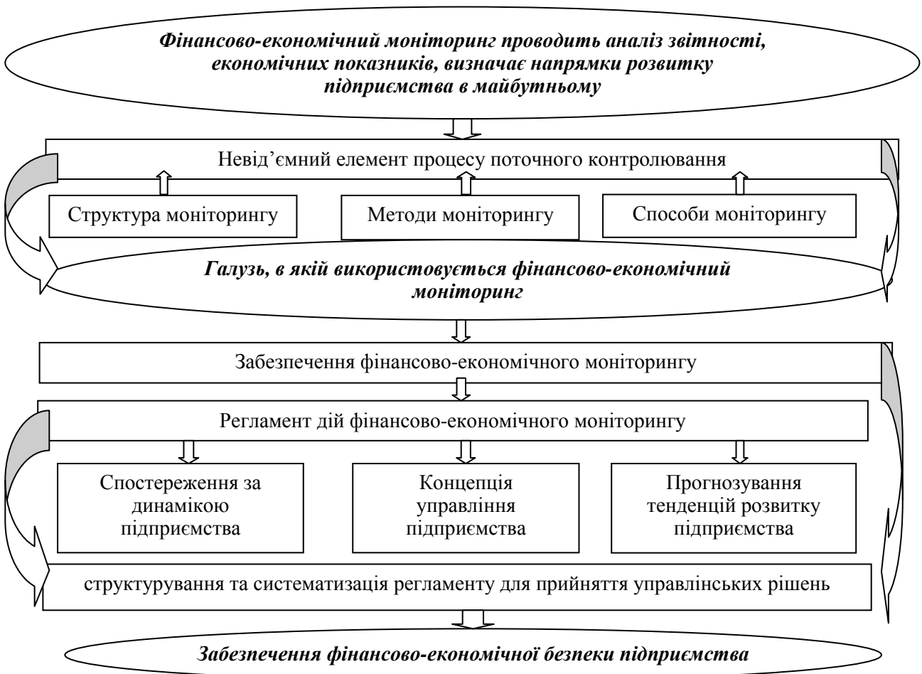
Рис. 1. Система функціонування фінансово-економічного моніторингу Примітка: розроблено автором

Розроблено систему функціонування фінансово-економічного моніторингу, як інструменту забезпечення фінансово-економічної безпеки підприємства (рис. 1).