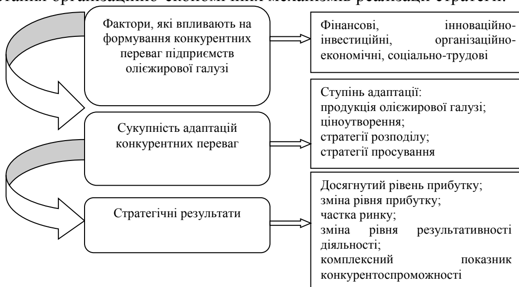
Рис. 3. Концептуальна модель стратегічної адаптації конкурентних переваг підприємств олієжирової галузі

Визначено, що фактори, які впливають на формування конкурентних переваг переробних підприємств також впливають на процес їх стратегічної адаптації. З'ясовано, що сукупність адаптації конкурентних переваг переробних підприємств визначають шляхи досягнення намічених цілей та результати стратегічної адаптації конкурентних переваг залежать від ефективності використання організаційно-економічних механізмів реалізації стратегії.