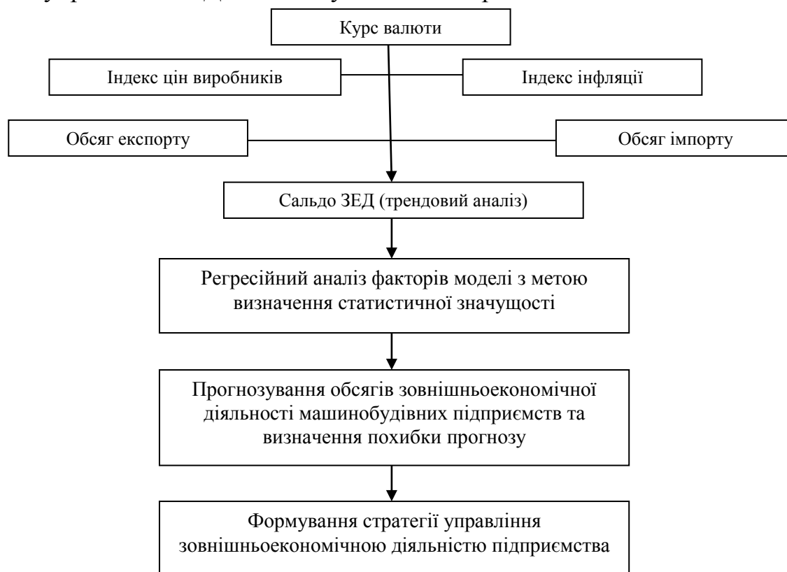
Рис. 2. Deskриптивна модель управління зовнішньоекономічною діяльністю машинобудівного підприємства

регресійного аналізу обсягів експорту та імпорту. Наступним етапом є прогнозування обсягів зовнішньоекономічної діяльності та формування стратегії управління ЗЕД машинобудівного підприємства.