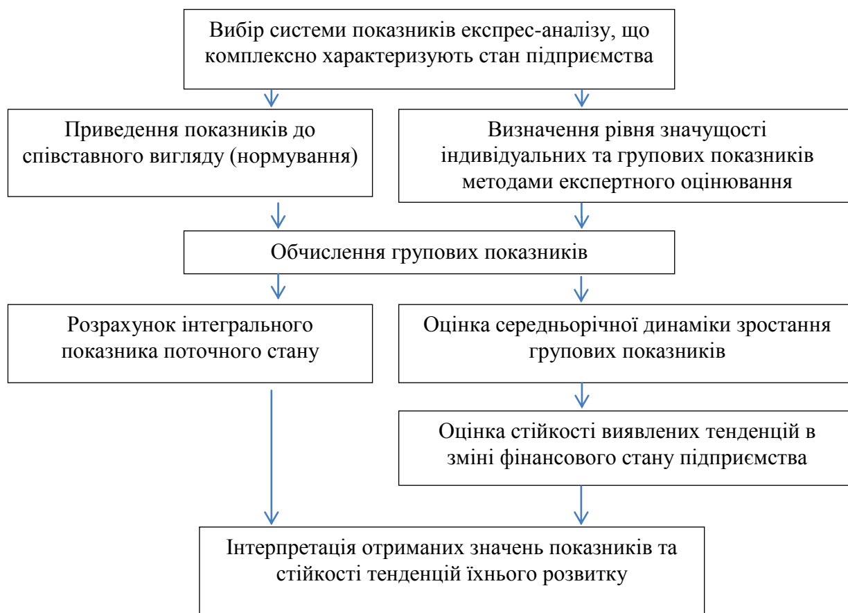
Рис. 3. Методичний підхід до діагностики схильності підприємства до банкрутства