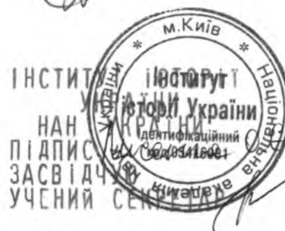
О. Є. Лисенко

Відгук підготував завідувач відділу історії України періоду Другої світової війни, Інституту історії України НАНУ д.і.н., професор